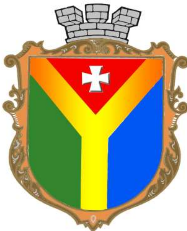
Герб м. Шепетівки