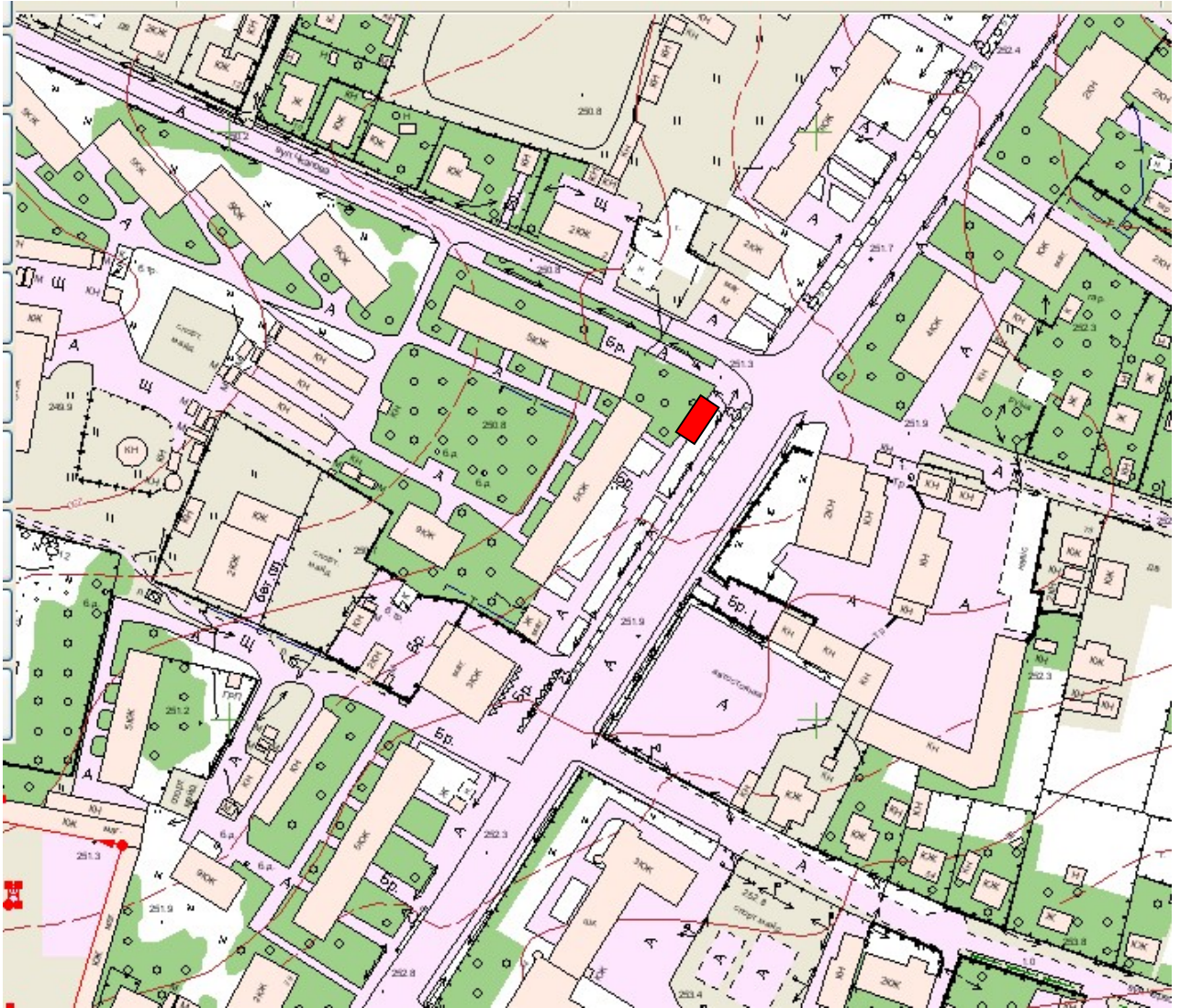
Схема облаштування літнього майданчика по вул. Героїв Небесної Сотні, 35-к