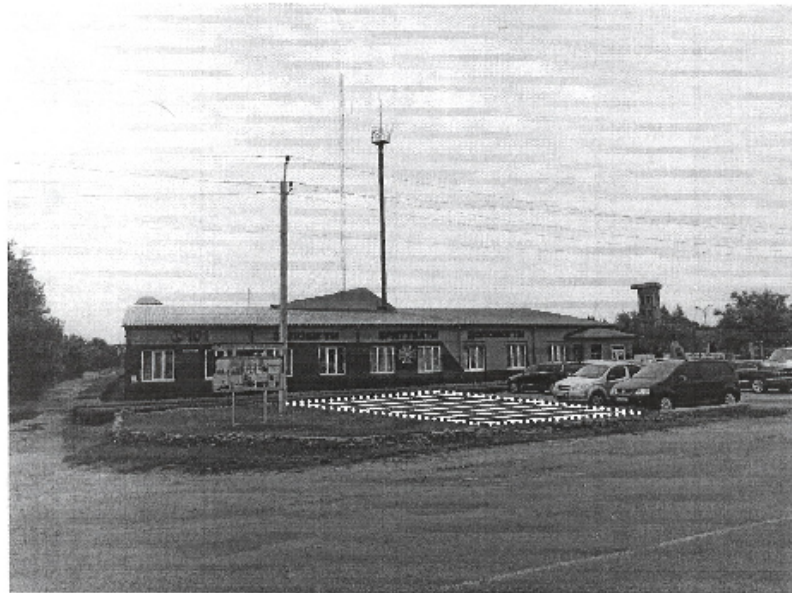
СХЕМА розширення стоянки на прилеглої території 21 ДІРЧ 5 ДІРЗ ГУ ДСНС України у Хмельницькій області, за адресою м.Пепетівка вул. Митрополита Шептицького, 53

Додаток до рішення виконавчого комітету міської ради від __07.2023 №__